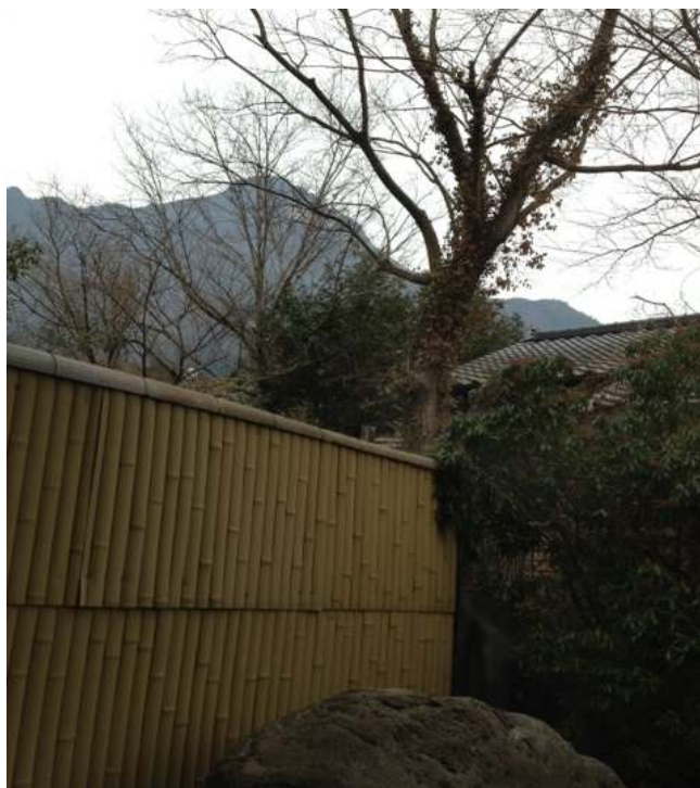
↑お風呂から見える由布岳

1時間貸切で、大人2人で4,000円 + 小・中学生500円 幼稚園児無料でした。